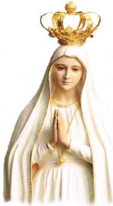
Consagradme vuestros corazones

¿Os acordáis cuando Jesús tomó consigo a Pedro , a Juan y a Santiago y subió al monte a orar y cómo mientras oraba su rostro cambió de aspecto y su vestidura se hizo luminosa y resplandeciente (Lc 9, 28b-29)? ¿No es realmente así como María quiere vernos? ¿Es acaso esto un imposible para nosotros? Nada de eso, porque para Dios todo es posible, y es El quien obrará esto en nosotros, porque para esto El ha venido al mundo, entre nosotros y en nosotros, y es por eso que María también hoy nos recuerda: Yo estoy con vosotros e intercedo ante mi Hijo por cada uno de vosotros. No hay excusas: está en nosotros, en cada uno de nosotros, el aceptar o el rechazar esta gracia grande que se nos ofrece una vez más. ¿A que esperamos pues en abandonarnos a Su Amor? ¡Paz y alegría en Jesús y María!