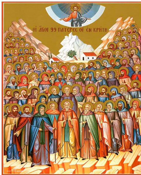
1 nov. Solennità di Tutti i Santi

I commenti ai messaggi a cura di Nuccio Quattrocchi